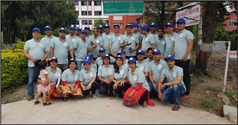
९७ औं अन्तर्राष्ट्रिय सहकारी दिवस, जुलाई ६, सहकारी विभाग परिसर