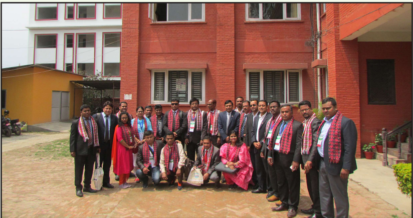
सहकारी विभाग भ्रमणमा बङ्गलादेशका सहकारीकर्मीहरू