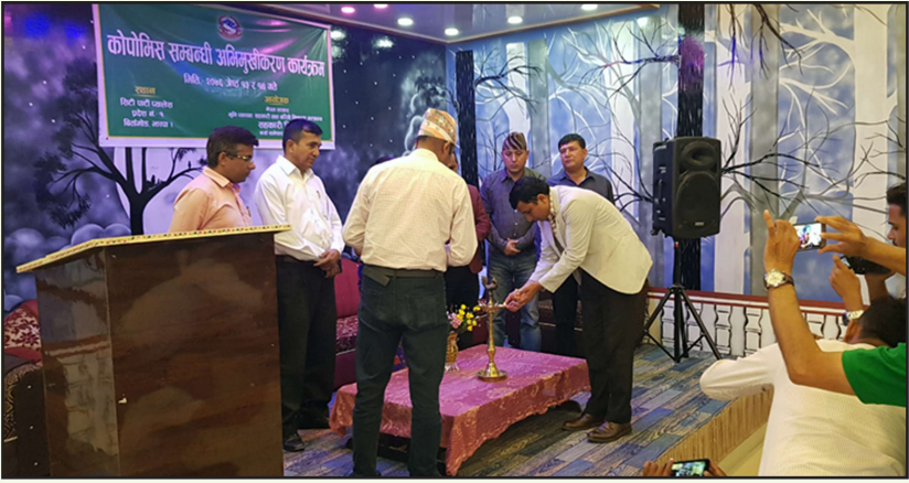
COPOMIS अभिमुखिकरण शुभारम्भ, प्रदेश-१, भापा